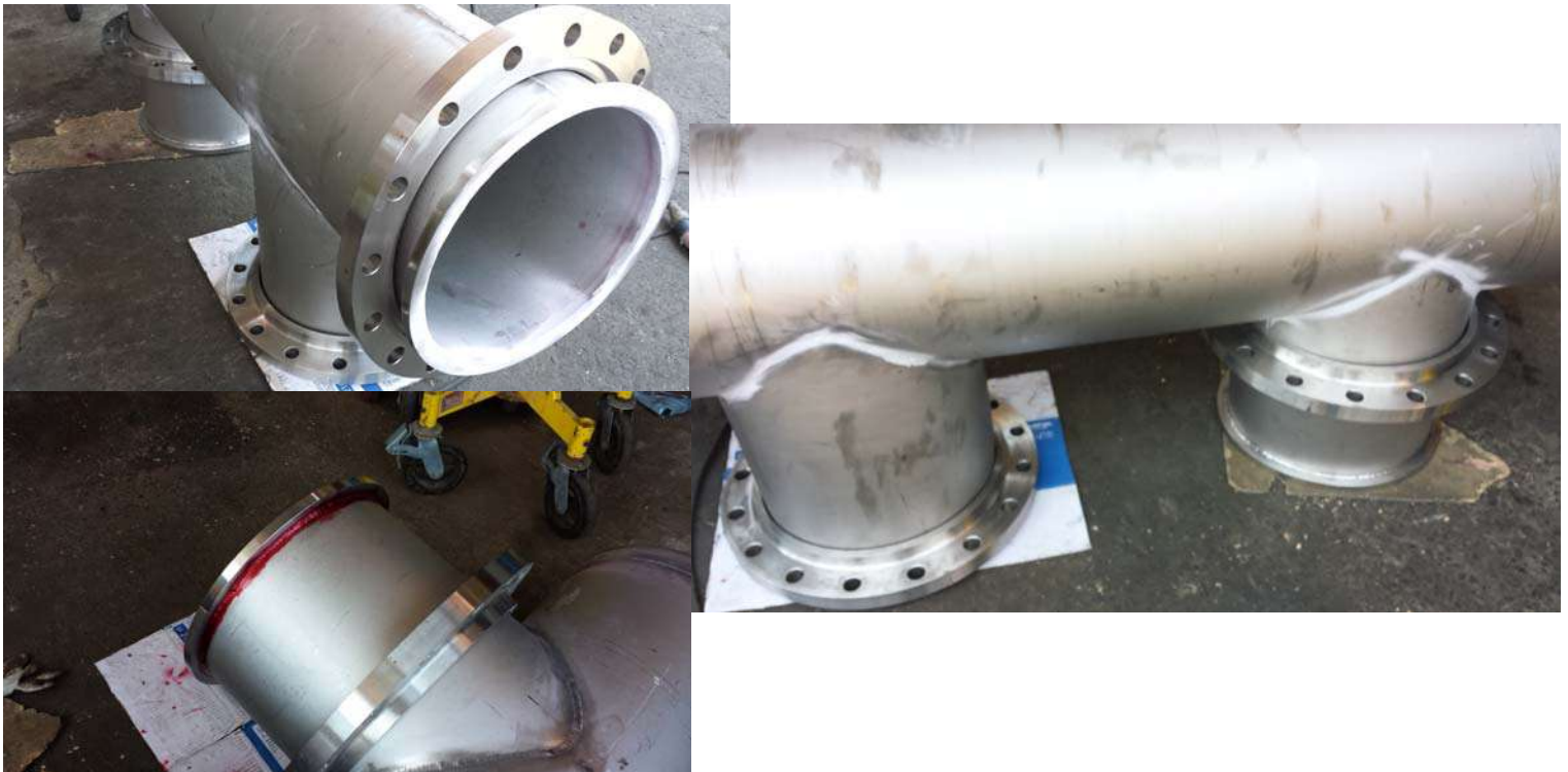
Lineas de 24'' sch 40 duplex 2205 descarga Tk electrolito rico