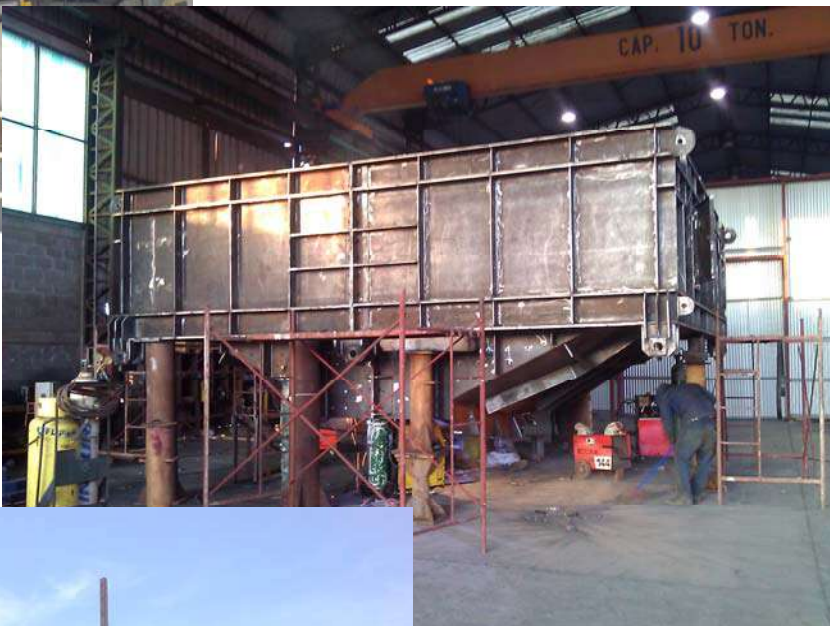
Levantamiento, ingeniería, calculo y fabricación de chute de descarga chancador primario