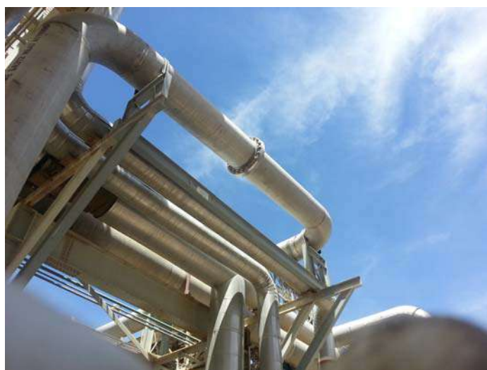
Fabricación de línea refluo 24'' inox 316L