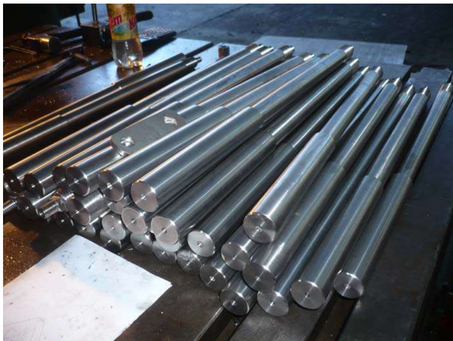
Fabricación de patas de araña (Stromback) Aisi 316L