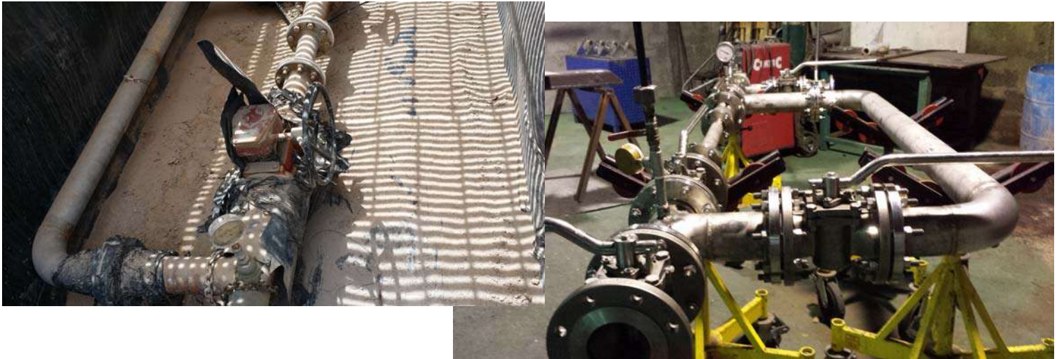
Fabricación de cuadros de acido en 4'' sch 40 316L