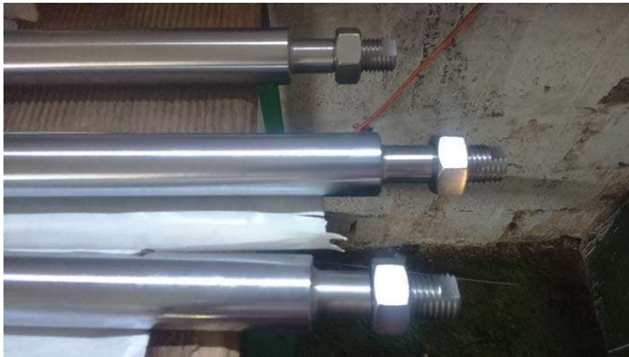
Fabricacion de herramientas manuales y ejes inox 316L Titanio Gr2 MDC