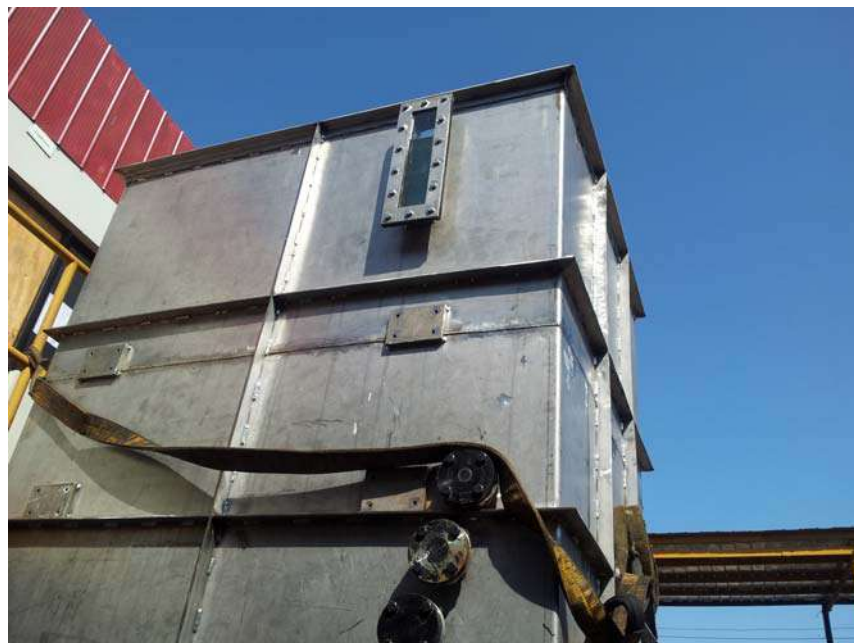
Estanques de agua acida inox 316L